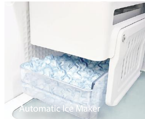
Automatic Ice Maker

یخساز اتوماتیک با قابلیت اتصال به آب شهری و فیلتراسیون آب