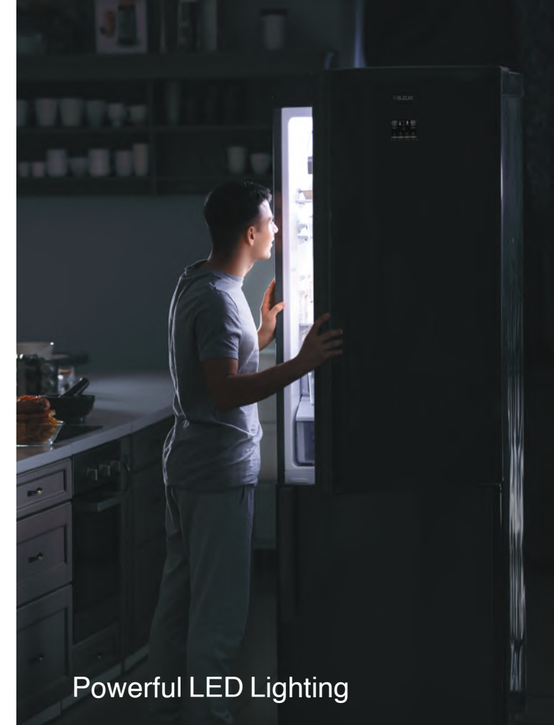
Powerful LED Lighting

The LED lighting of the Suzuki refrigerators is brighter and long-lasting, It lights up space inside by saving energy.