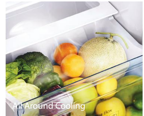
All Around Cooling

یخساز اتوماتیک با قابلیت اتصال به آب شهری و فیلتراسیون آب