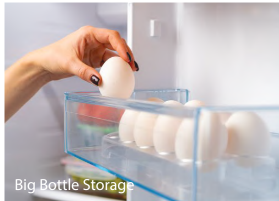
Big Bottle Storage

دستگیره های استیل ارگونومیک با شکل ظاهری خاص و متمایز