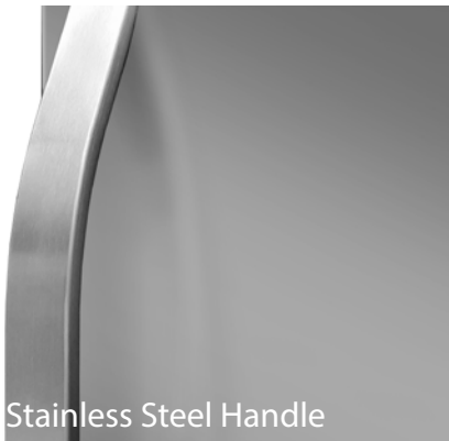
Stainless Steel Handle

دستگیره های استیل ارگونومیک با شکل ظاهری خاص و متمایز